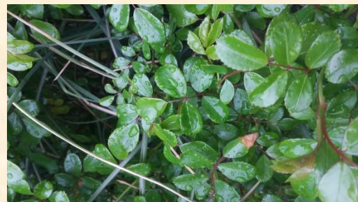
Auf den Rosenblättern stehen die Regenperlen.

Um 11 Uhr beginnt es anhaltend zu regnen. Auch um 14 Uhr regnet es noch – ein andauernder, sanfter Landregen hat eingesetzt.