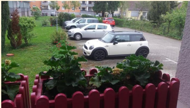
Auf dem weißen Auto mit dem schwarzen Dach sind Regentropfen auf dem Dach

Es kann daran liegen, daß jene Bereiche, die trocken geblieben sind, noch nicht mit Lebensenergie (Bowis) angefüllt wurden.